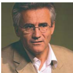
André Comte-Sponville 10ème Université