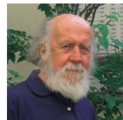
Hubert Reeves 12ème Université