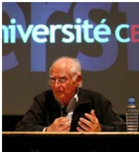
Michel Serres - 11 ème Université