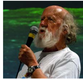
Hubert Reeves - 12 ème Université